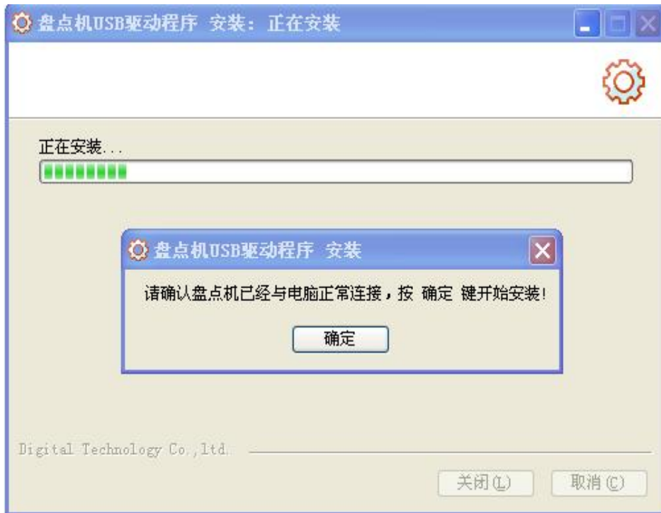
图2 SX700盘点机USB驱动程序安装