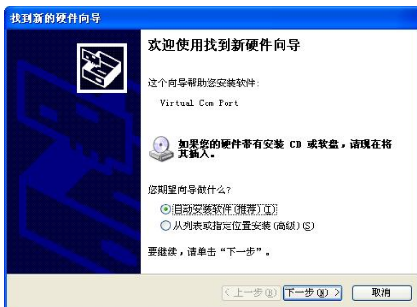
图1 找到新的硬件向导